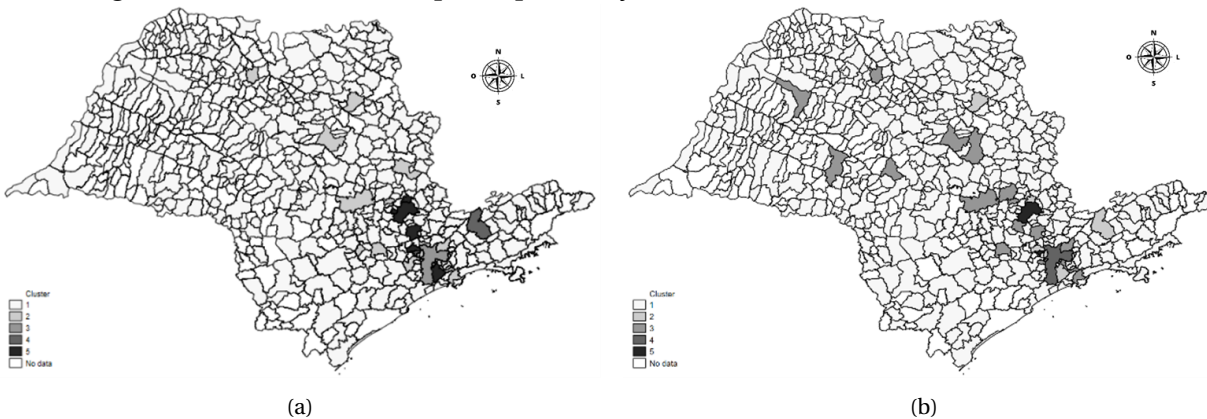
Figura 03 – Análise de clusters para especialização em T-KIBS (São Paulo, 2010 (a) e 2019 (b))