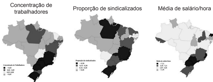
Figura 1 Informações dos trabalhadores empregados na indústria de metalurgia – Brasil, 2007